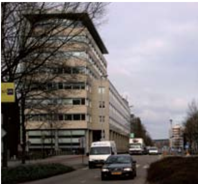
Het PMBgebouw aan de Weesperstraat

PMB heeft in het kader van duurzaam onderhoud met twee partijen een opmerkelijk contract afgesloten. Het eerste is een bonus-maluscontract met een groot onderhoudsbedrijf: bij goede prestaties krijgt het bedrijf een bonus, bij slechte betaalt het bedrijf. Energiebesparing met behoud van comfort is onderdeel van dit contract. Daarmee heeft het bedrijf zich