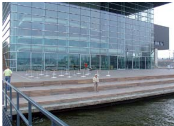
Terras van FSC-hout voor het Muziekgebouw aan 't IJ.

kent de markt van het FSC-hout van a tot z en verzorgt de begeleiding en uitvoering van het hele inkooptraject voor gemeentelijke opdrachtgevers. Van Essen: “Ik word het liefst in de pre-bestekfase bij een project betrokken. Dan kan ik op tijd advies geven. Vaak is het bijvoorbeeld beter geen specifieke houtsoort te noemen maar de vereiste kenmerken