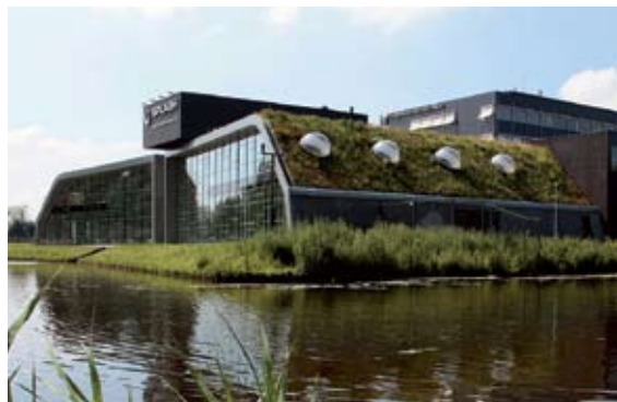
Academie voor Lichamelijke Opvoeding in Osdorp, met grasdak