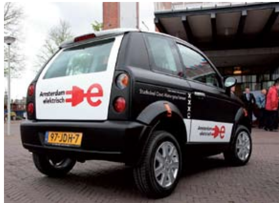
Elektrische dienstauto van stadsdeel Oost-Watergraafsmeer

“Duurzaamheid is een belangrijk element in ons beleid. We houden uiteraard rekening met de veiligheid en (comfort)wensen van onze