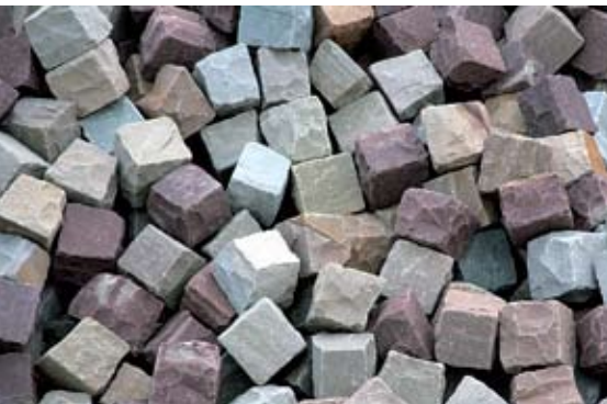
Keien voor bestrating bij de Materiaaldienst