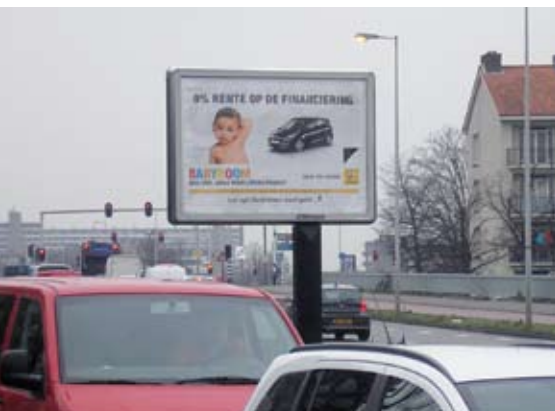
Een duurzaam billboard in Bos en Lommer